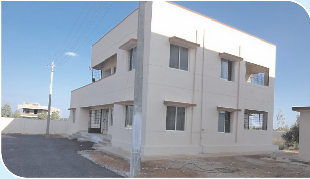
3 Fire Officers Quarters, Chickaballapur