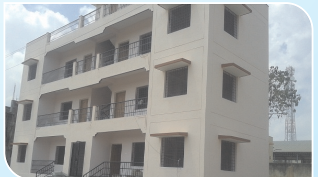
6 PC Quarters, Turuvukere