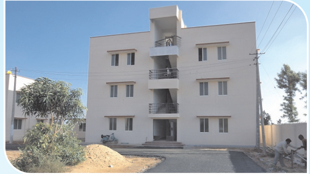
12 Firemen Qtrs, Chickaballapur