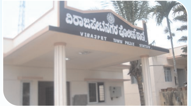
Virajpet Police Station