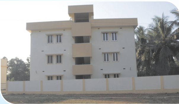
12 Firemen Quarters, Bantwal