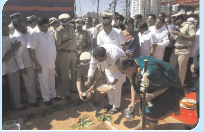
ಗುದ್ದಲಿ ಪೂಜಾ ಕಾರ್ಯಕ್ರಮ.