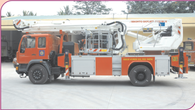
Aerial Ladder Platform

KSPHC has recently procured two Aerial Ladder Platforms of 31-34 mts & 52-54 mts working height each from M/s Bronto Skylift, Finland, for Karnataka State Fire & Emergency Services.