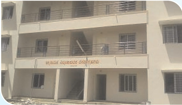
6 Firemen and 2 Fire Officers' Quarters, Kushalnagar