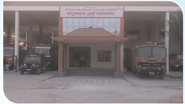
6 Bay Fire Station, Raichur