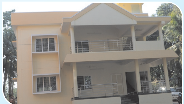
Sub-Divisional Police Office and Asst. Commissioner of Police Office, at Pandeshwar, Mangalore