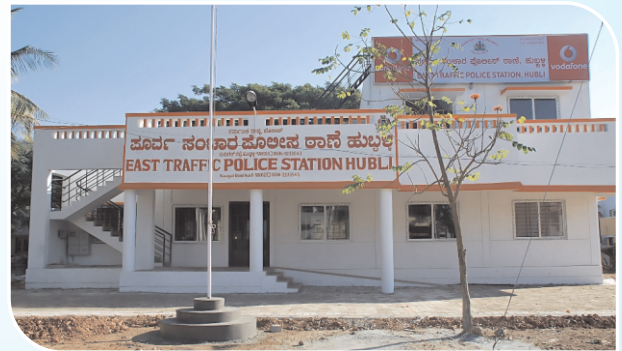
East Traffic Police Station, Hubli