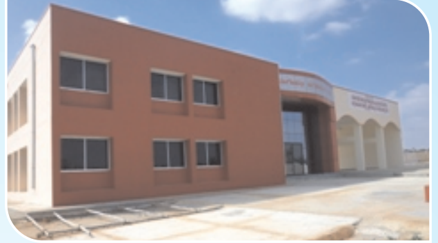
Fire Station, Bagepally