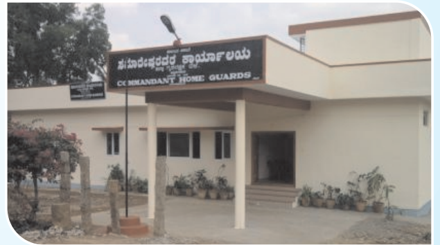
District Training Centre for Home Guards, Chickmagalur