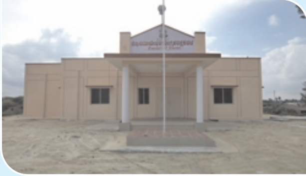
District Training Centre for Home Guards, Kolar