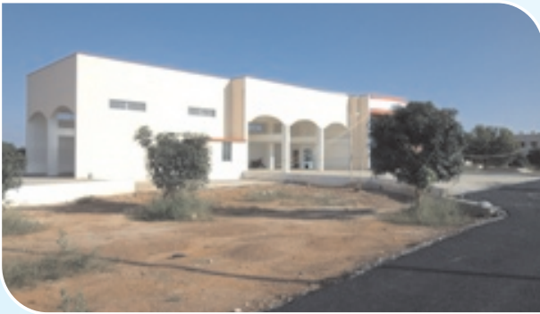
Fire Station, Chickaballapur