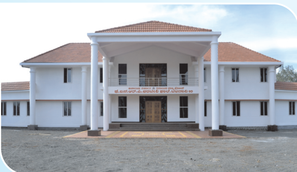
Admin Block, Teaching Block for KSRP Training School at APMC, Kangarali in Belgaum