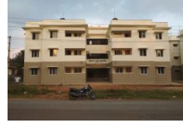
64PC/12 SI Qtrs, Sirsi Circle 64PC/12SI ಕಾಪ್, ಸಿರ್ಸಿ ಸರ್ಕಲ್