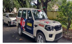
ERSS Launch ERSS ಲಾಂಚ್