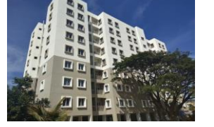
64 PC Qtrs, Kadugodi 64 PC ಕಾಪ್, ಕಾಡುಗೋಡಿ