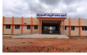
PPS Davanagere PPS ದಾವಣಗೆರೆ