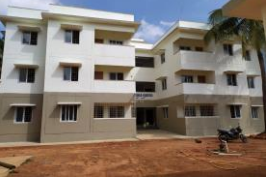
24 PC qtrs, Siddapur 24 PC ಕಾಪ್, ಸಿದ್ಧಾಪುರ

ಜನವರಿ 17 ರಂದು ಗೌರವಾನ್ವಿತ ಕೇಂದ್ರ ಗೃಹ ಸಚಿವ ಶ್ರೀ. ಅಮಿತ್ ಷಾ ನಮ್ಮ ರಾಜ್ಯಕ್ಕೆ ಭೇಟಿ ನೀಡಿದರು ಮತ್ತು ನಮ್ಮ ನಿಗಮವು ಈ ಕೆಳಗಿನ ಕಟ್ಟಡವನ್ನು ಉದ್ಘಾಟಿಸುವ ಗೌರವವನ್ನು ಮಾಡಿದರು