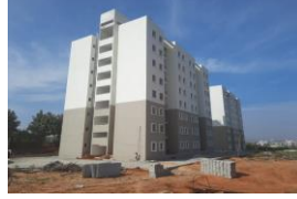
128 PC, Sampigehalli 128 PC, ಸಂಪಿಗಹಳ್ಳಿ