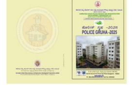
Police Gruha 2025 Launch ಪೊಲೀಸ್ ಗೃಹ 2025 ಲಾಂಚ್