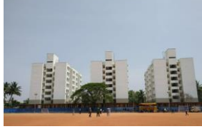
192 PC Qtrs, Astin Town 192 PC ಕಾಪ್, ಅಸ್ಟಿನ್ ಟೌನ್