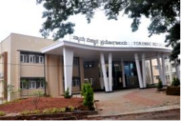
FSL, Madiwala FSL, ಮದಿವಾಳ