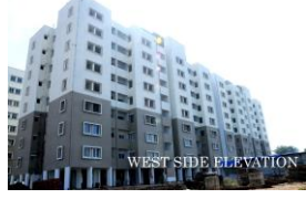
128 PC Qtrs, Nagrabhavi 128 PC ಕಾಪ್, ನಗರಭಾವಿ