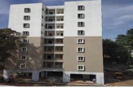
32 SI Qtrs, Cole Road 32 SI ಕಾಪ್, ಕೋಲ್ ರೋಡ್