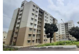
192 PC Qtrs, Adugodi 192 PC ಕಾಪ್, ಆಡುಗೋಡಿ