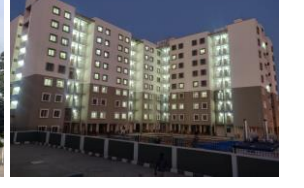
198 PC Qtrs, K R Puram 198 PC ಕಾಪ್, ಕೆ ಆರ್ ಪುರಂ