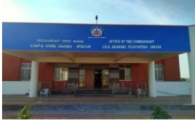
IRB Munirabad Admin Block IRB ಮುನಿರಾಬಾದ್ ಅಡ್ಮಿನ್ ಬ್ಲಾಕ್