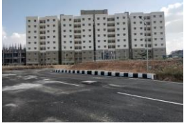
128 PC Qtrs, Binny Mill 128 PC ಕಾಪ್, ಬಿನ್ನಿ ಮಿಲ್